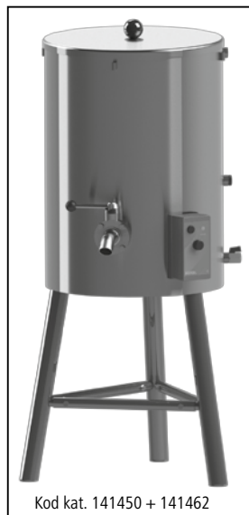
Kod kat. 141450 + 141462